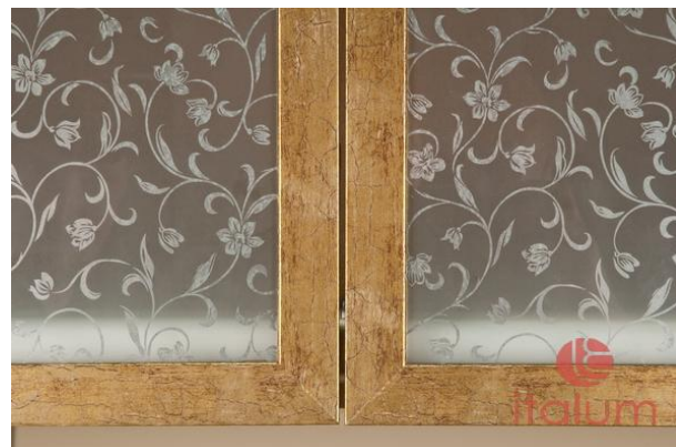
Примеры фасадов ITALUM-METRO с наполнением из ДСП и стекла