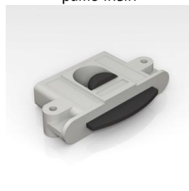
Ролик ITALUM-COMPACT верхний