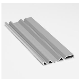
Трек двойной нижний рамочный