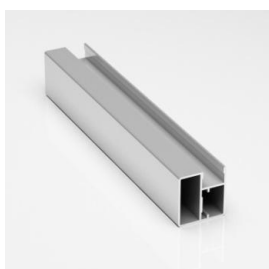
Профиль MILAN рамочный