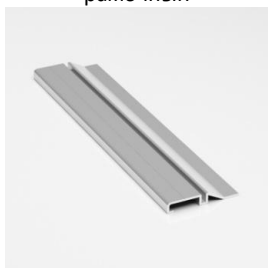
Трек одинарный верхний рамочный