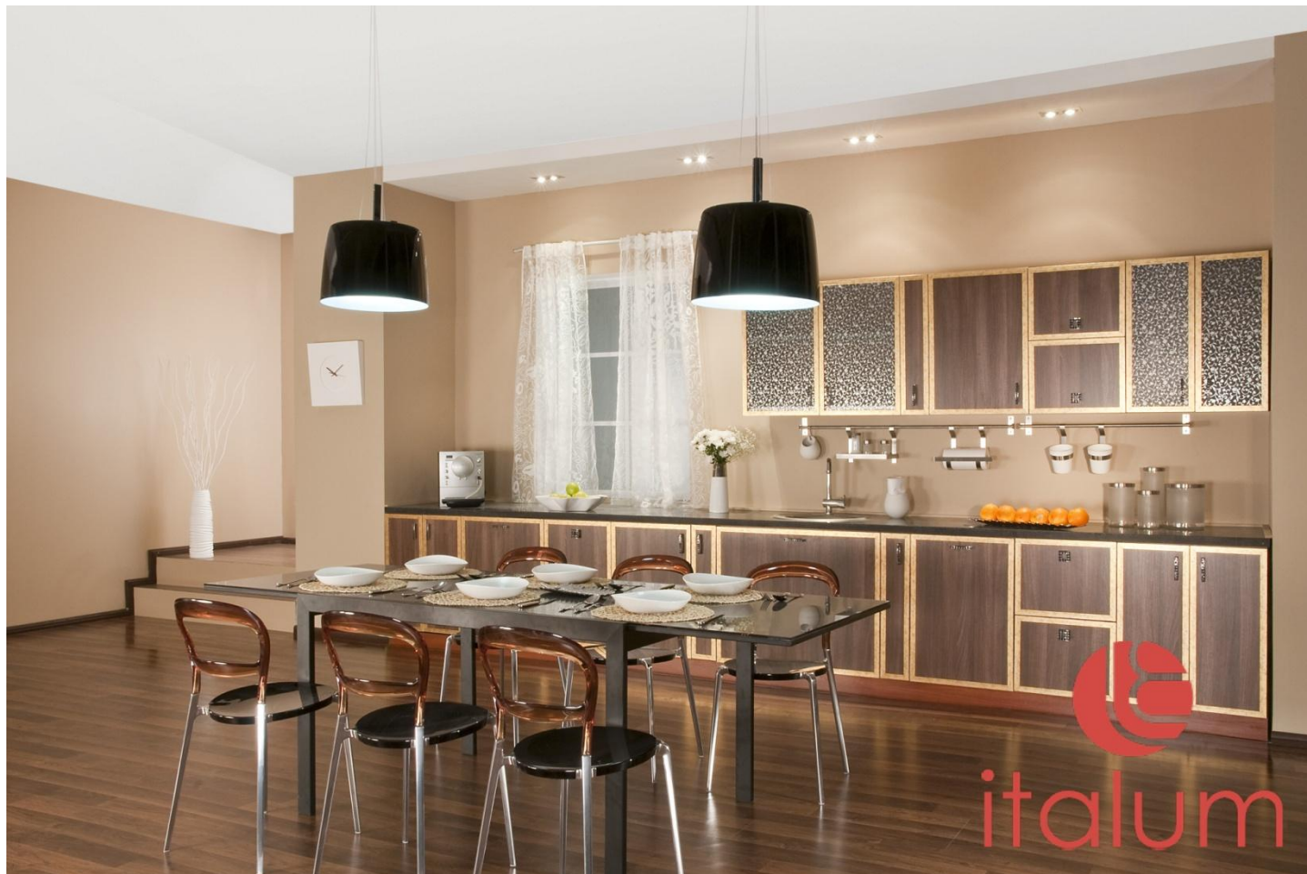
Кухня: Профиль ITALUM-MILAN в декоре Золото Сапо Di Monte

Система ITALUM-COMPACT , идеально сочетается со всей линейкой продукции Фабрики профилей «ИТАЛЮМ» и может применяться как совместно с ней (дверцы, элементы мебели), так и отдельно.