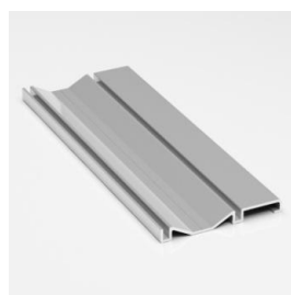
Трек двойной верхний рамочный