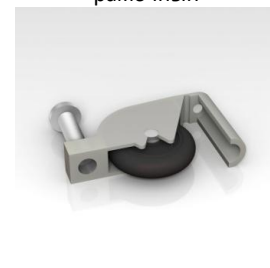
Ролик ITALUM-COMPACT нижний

ОБРАТИТЕ ВНИМАНИЕ! Фасадная система ITALUM-COMPACT доступна не только в стандартном для аналогов цвете « матовое серебро », но также производится во всех популярных декорах ITALUM . Для получения подробностей обратитесь к менеджерам нашей компании.